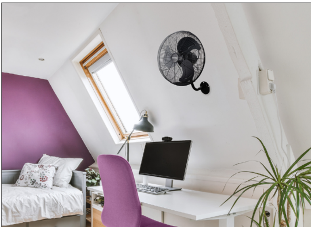
Modelo expuesto AURA090