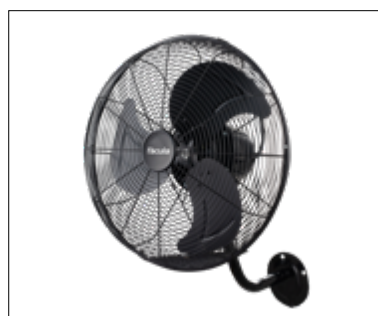
Perspectiva AURA2000 | Frontal y perspectiva AURA090