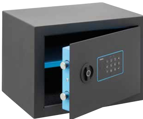
BLUE Ref. 650120