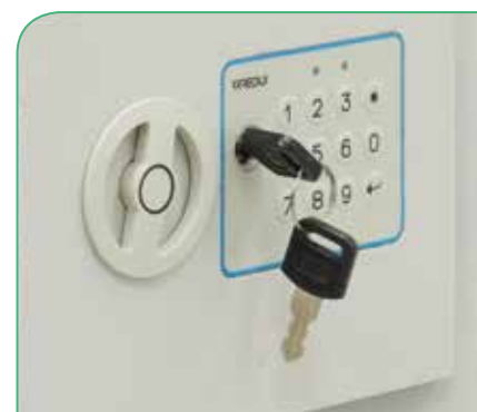
Con llave de emergencia.