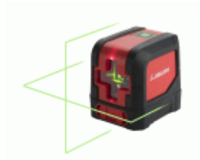
Nivel láser en cruz 20 m para trabajos de nivelación / NIV20