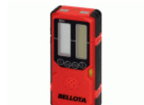
Receptor nivel láser hasta 50 m, rojo y verde / NIVRECEP