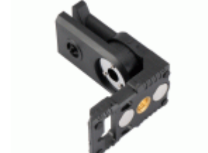
Soporte magnético giratorio con rosca 1/4' para niveles láser / NIVIMAN