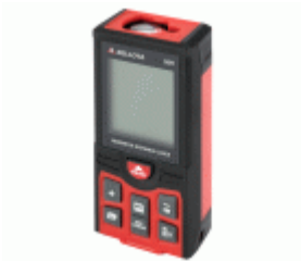
Medidor láser 50 m con nivel digital para trabajos de medición y cálculo de presupuestos / MED