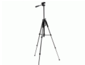
Trípode regulable con nivel para niveles láser / NIVTRIPOD15