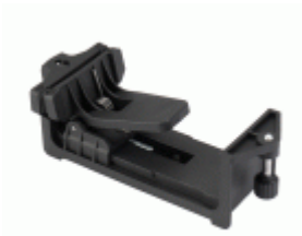
Pinza regulable para los niveles láser / NIVPINZA