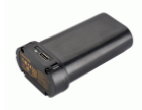
Batería Li-ion 3,7V 5200 mAH para nivel láser NIV30360R-V / NIVBAT