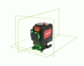
Nivel láser 3 planos de 360° y 30 m para trabajos de nivelación / NIV360T