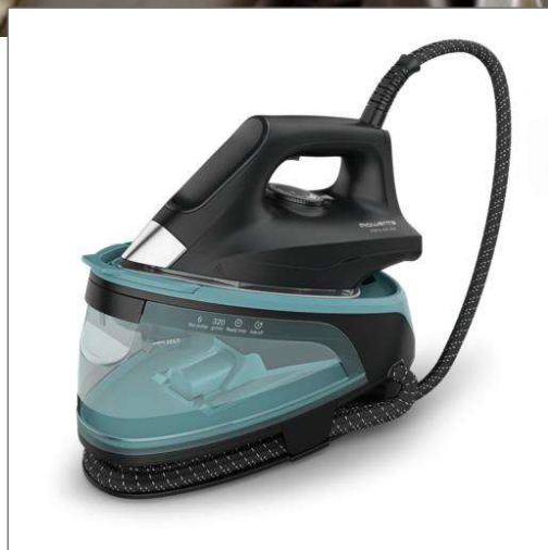
Force Pro 250 de Rowenta, centro de planchado, bomba de 6 bares, golpe de vapor de 320 g/min, azul y negro Centro de planchado VR4210F0