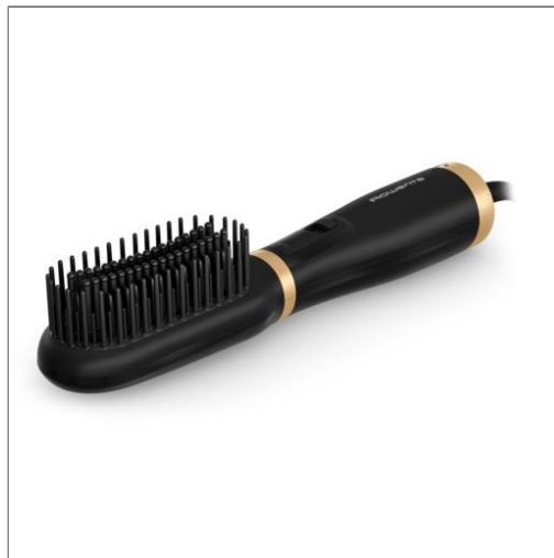
Powerstraight Air de Rowenta, cepillo de aire caliente, secado y alisado 2 en 1, Diseño compacto, Negro Cepillo de aire caliente UB5920F0